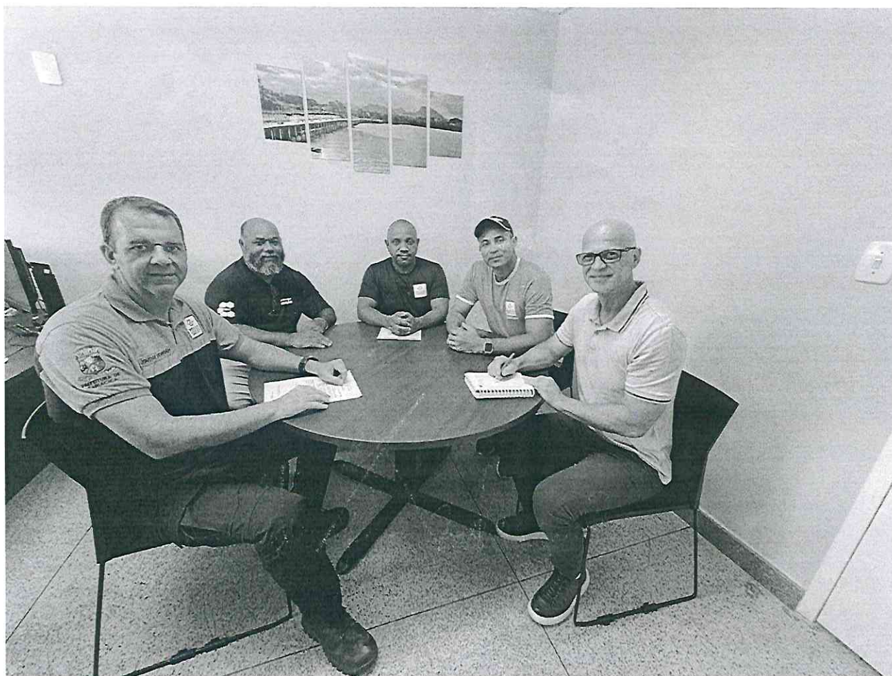
Registro da reunião ordinária realizada no dia 30/04/2026.